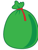
Bolsas de basura