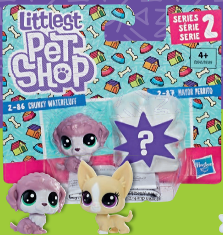
Littlest Pet Shop Mini-Tierpärchen