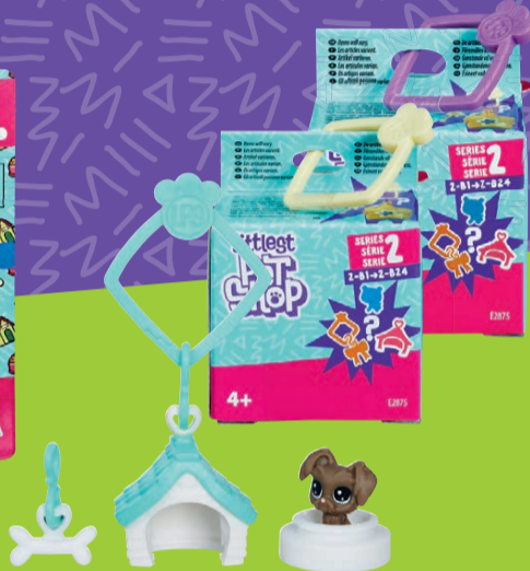
Littlest Pet Shop Überraschungstierchen